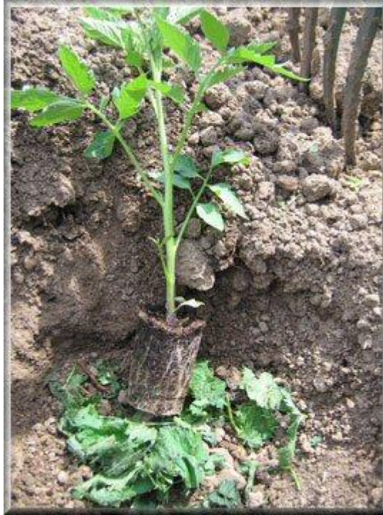
Position du plant