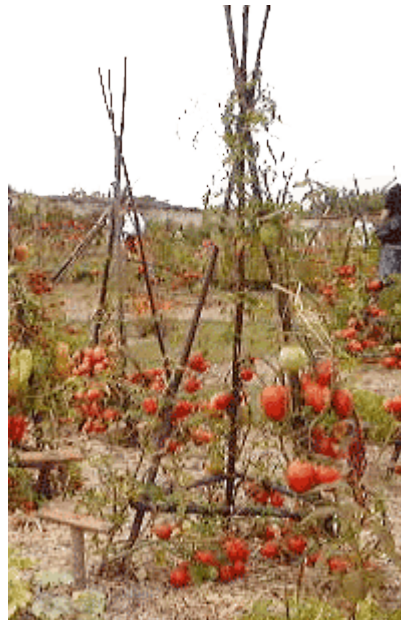
Structure pour tomates cerise