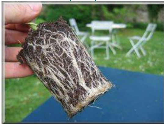
Un plant bien enraciné