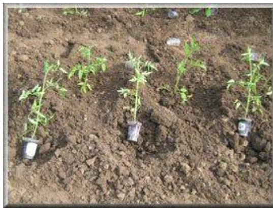
Placement des pieds selon le plan prévu !!