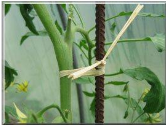
Attache en raphia