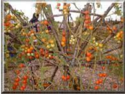
Tuteur en tipi