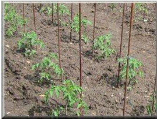
Jeunes plants tuteurés