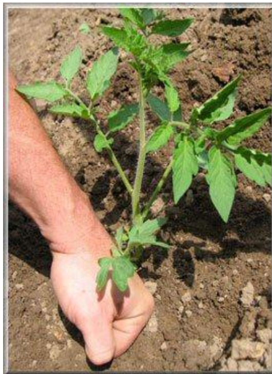
Bien tasser la terre autour du plant