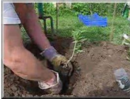
Plantation d' un pied de tomate