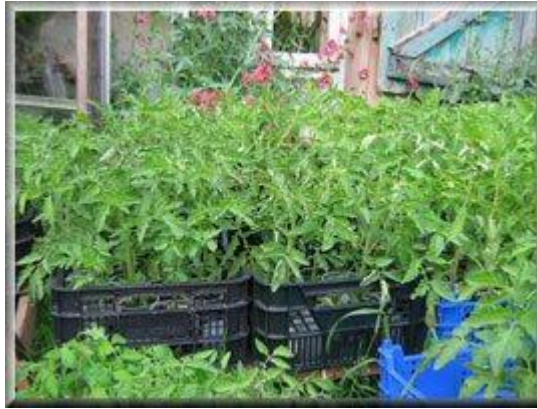
Pieds prêts à planter