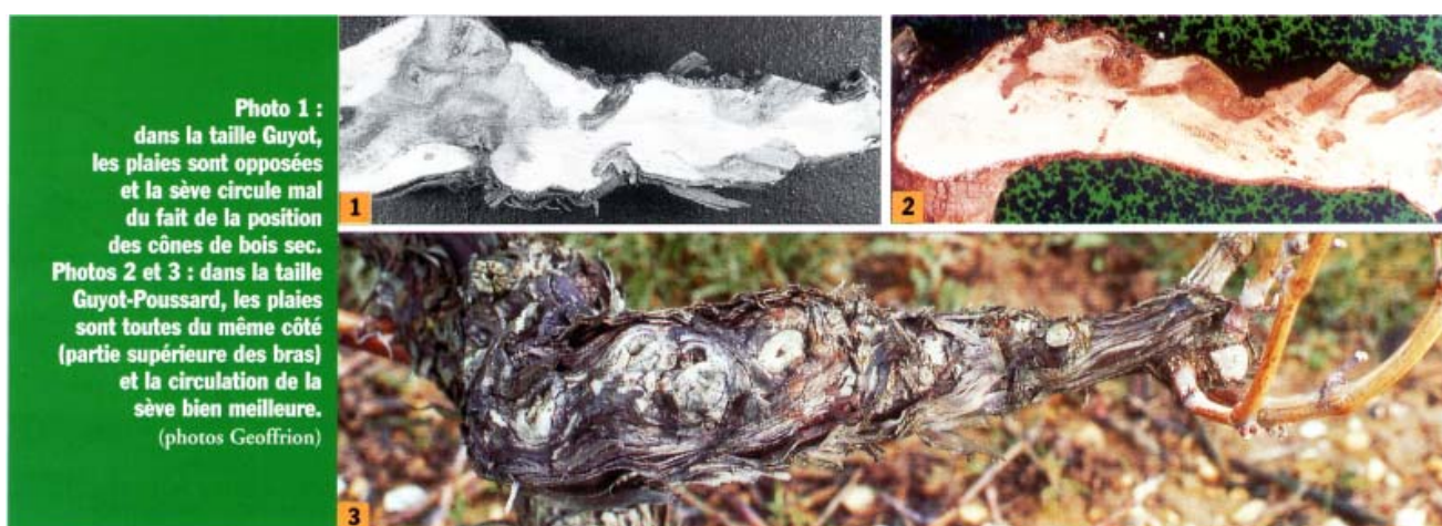
Photo 1 : dans la taille Guyot, les plaies sont opposées et la sève circule mal du fait de la position des cônes de bois sec. Photos 2 et 3 : dans la taille Guyot-Poussard, les plaies sont toutes du même côté (partie supérieure des bras) et la circulation de la sève bien meilleure.

Cette méthode permet de localiser les plaies de taille sur la partie supérieure des bras & d'assurer un bon espacement entre les plaies. Il se forme un « courant de sève » sur la face, inférieure des bras, favorable à la végétation.